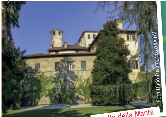
Castello della Manta