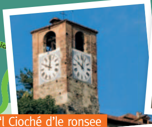
'I Cioché d'le ronsee