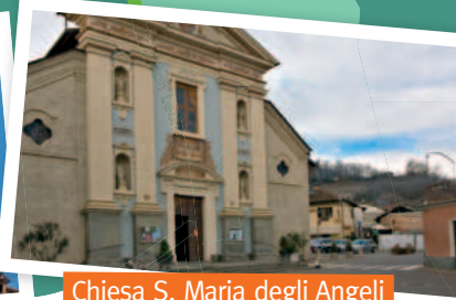
Chiesa S. Maria degli Angeli