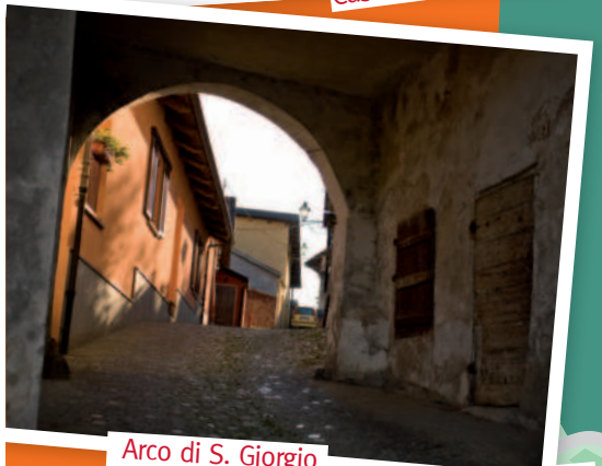
Arco di S. Giorgio