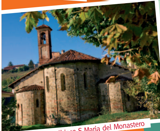
Chiesa S. Maria del Monastero